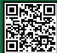
그린리모델링 창조센터 바로 가기

● 신청방법 : 온라인 접수 ( www.greenremodeling.or.kr )*