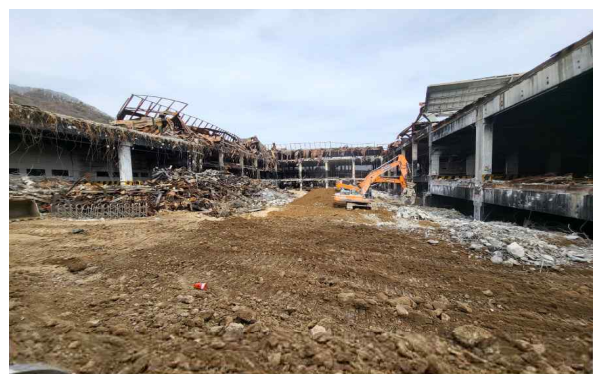
<현재 해체공사 전경(1공구 완료)>