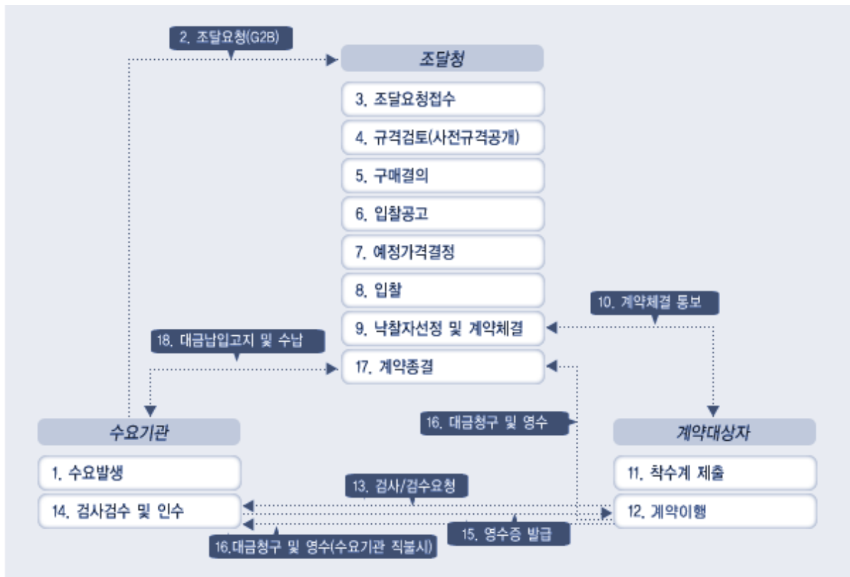
〈그림 2-2〉 조달청 물품구매업무 처리 절차